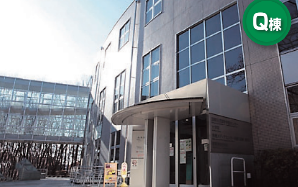
Media and Information Technology Center (Library)

図書資料は“39万冊を誇るコレクション” - 図書館は学ぶ意欲のある人々に開かれています -