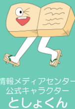
情報メディアセンター 公式キャラクター としょくん

※開館日・開館時間が変更になることがあります。 Webサイト・掲示などをご確認ください